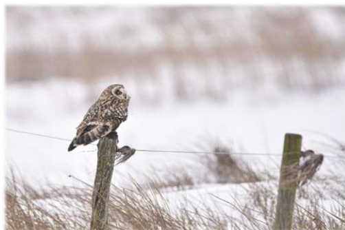
Mosehornugle fotograferet ved Tipperne ved Ringkøbing Fjord